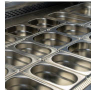
Designet til GN1/1 kantiner, ikke inkluderet