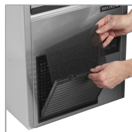
Kondensatorfilter er nemt at rengøre